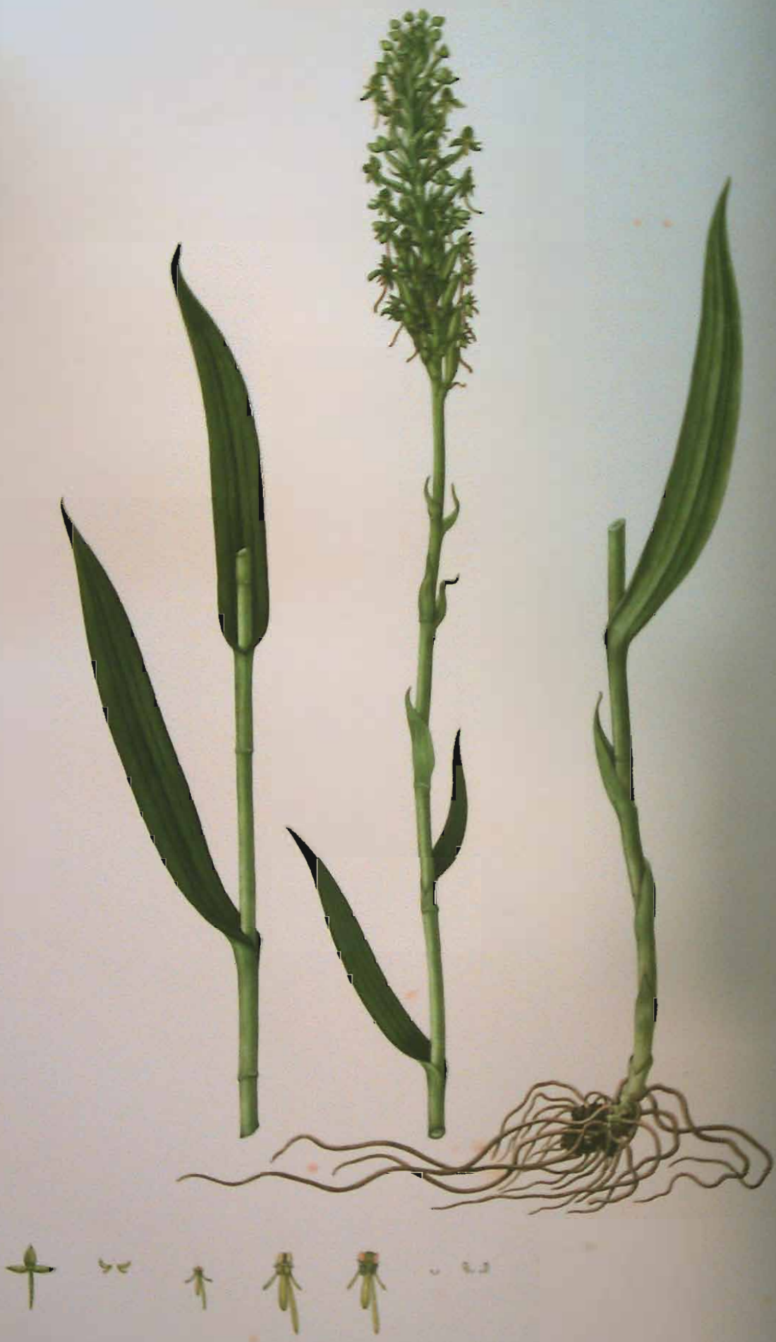
Habenaria parviflora Lindl.