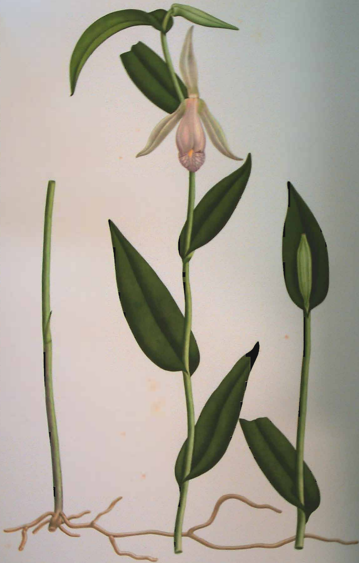
Pogonia rosea (Lindl.) Reichb. f.