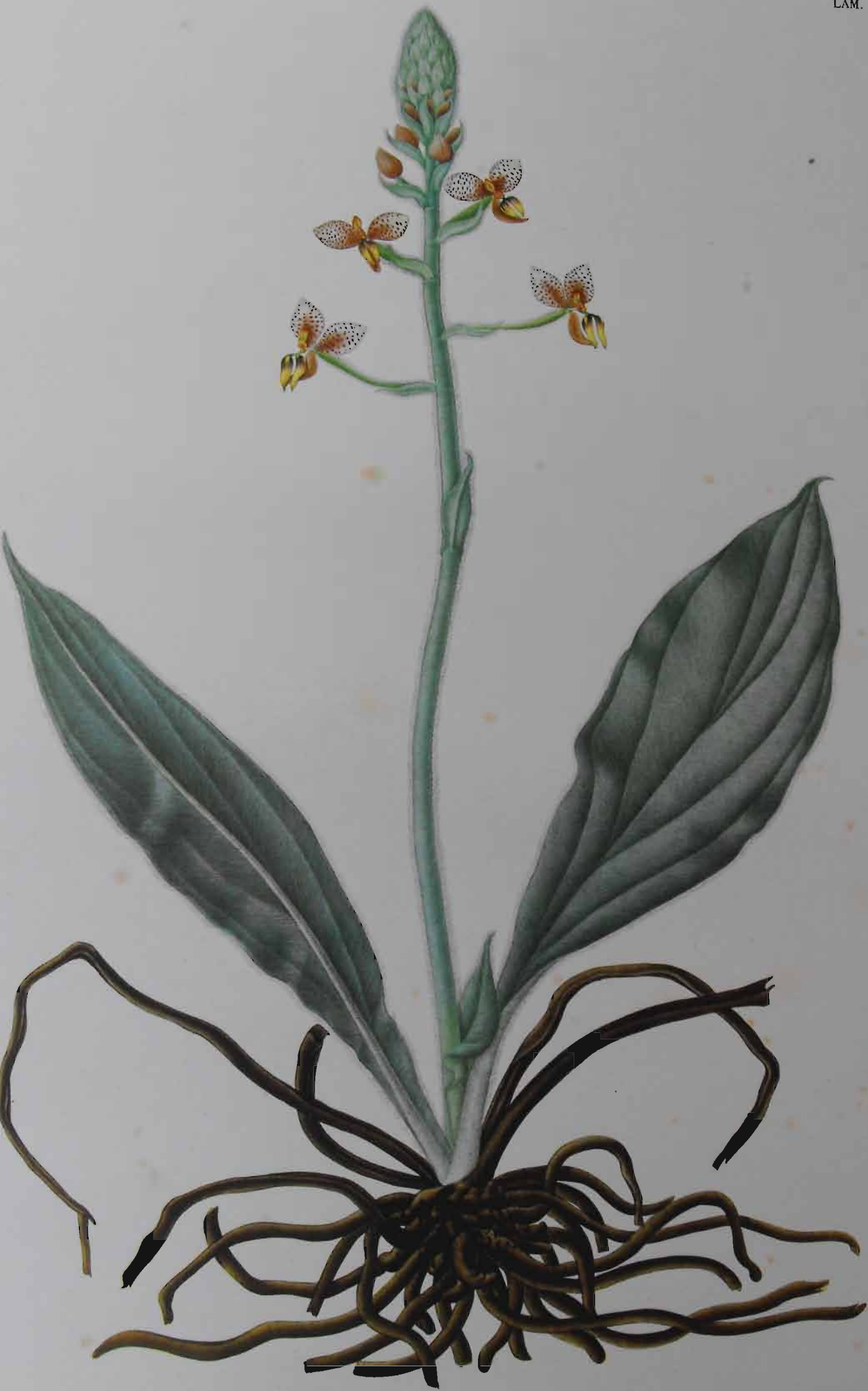
Ponthieva maculata Lindl.