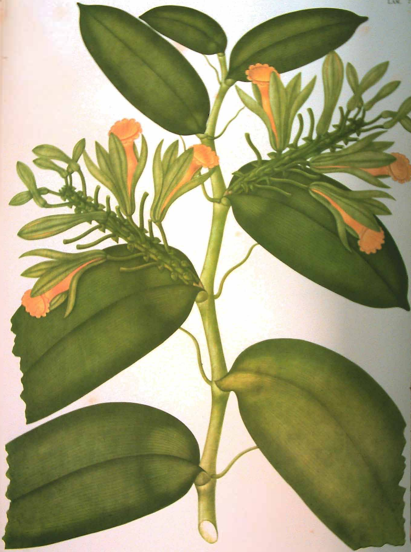
Vanilla planifolia Andr.