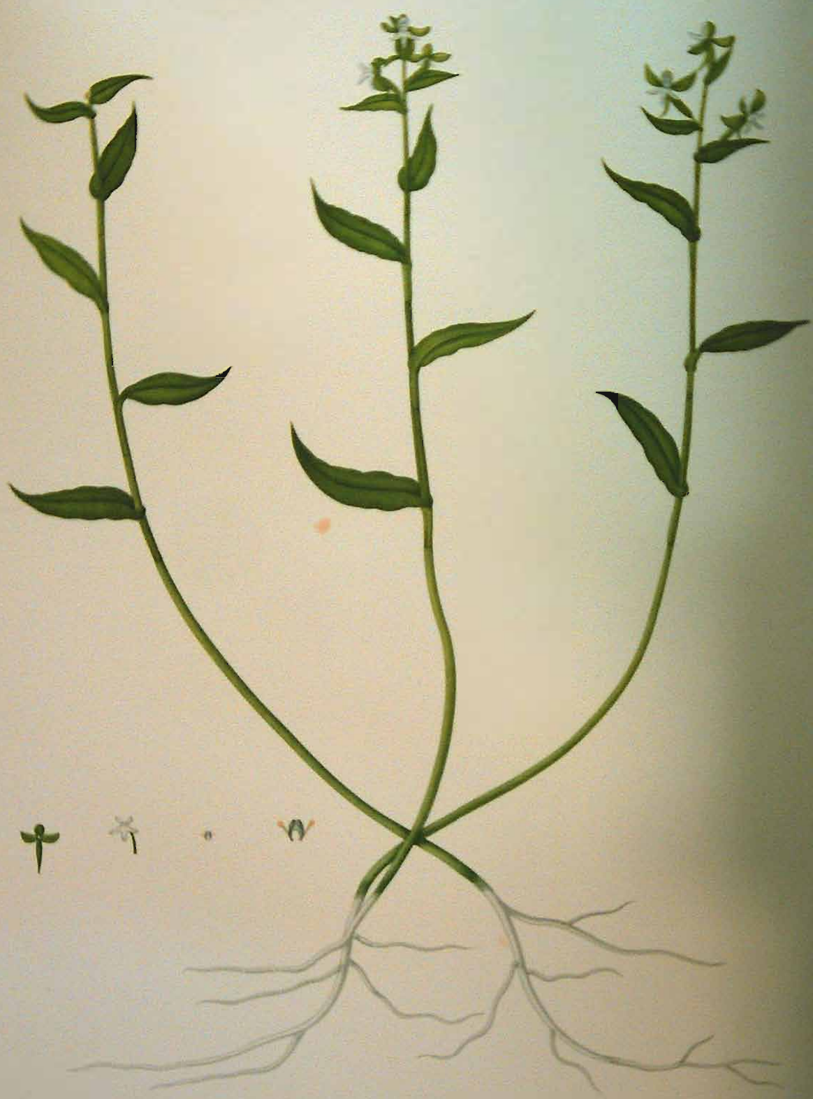
Habenaria corydophora Reichb. f.