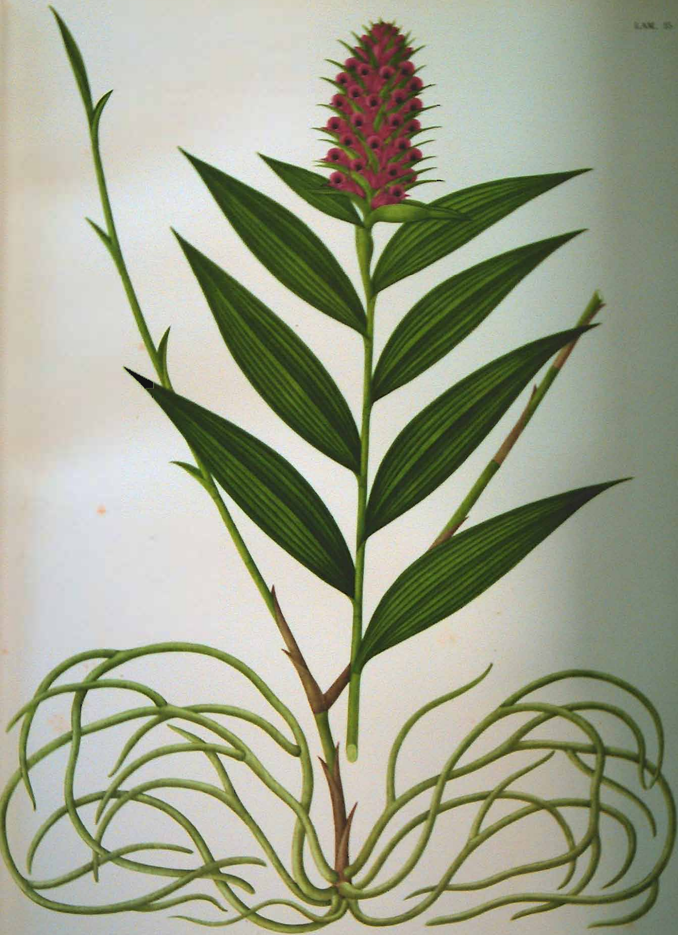
Elleanthus magnicallosus Garay