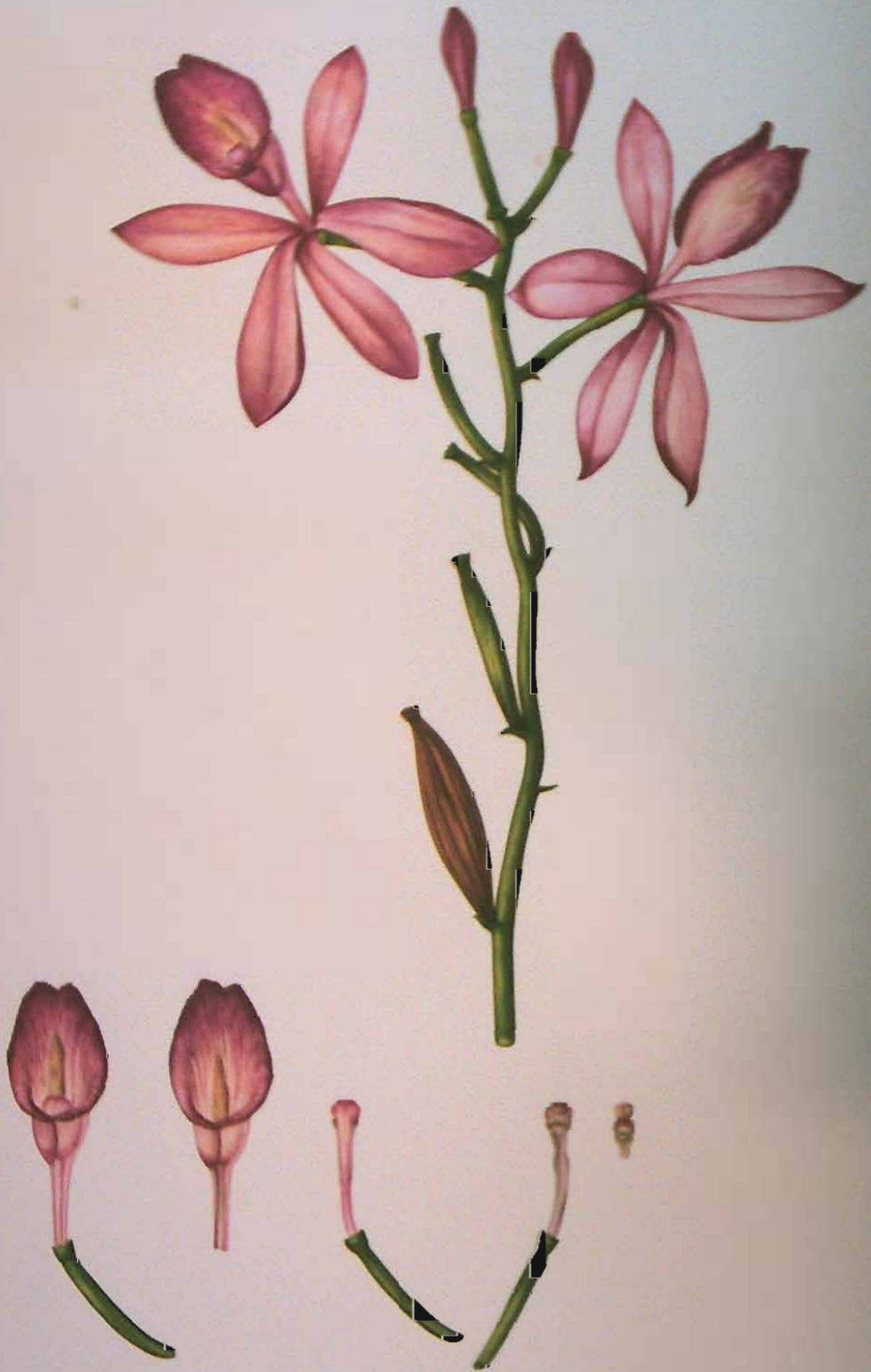
Epistephium Duckei Huber