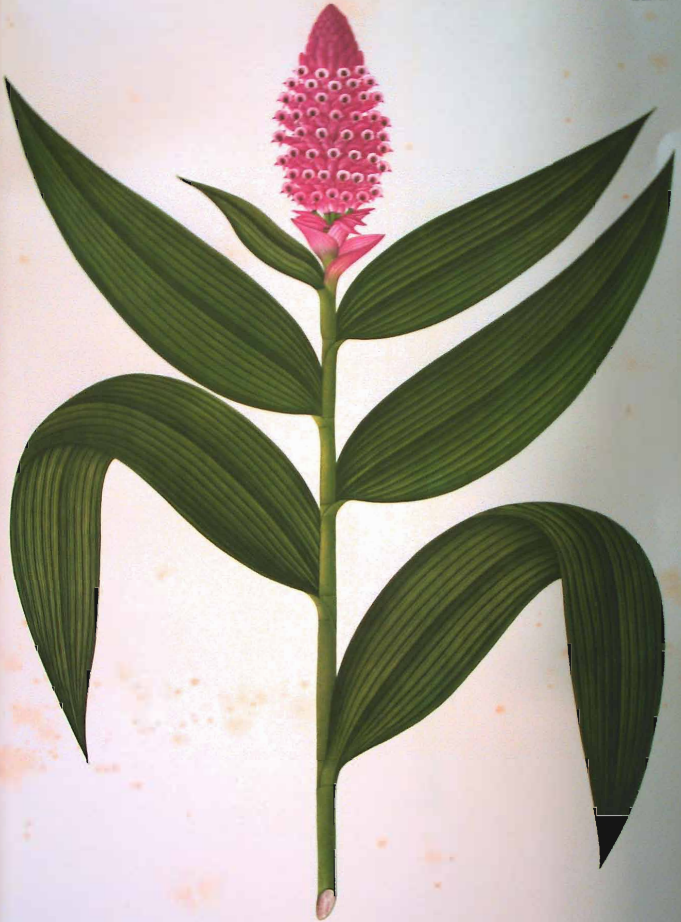
Elleanthus columnaris (Lindl.) Reichb. f.