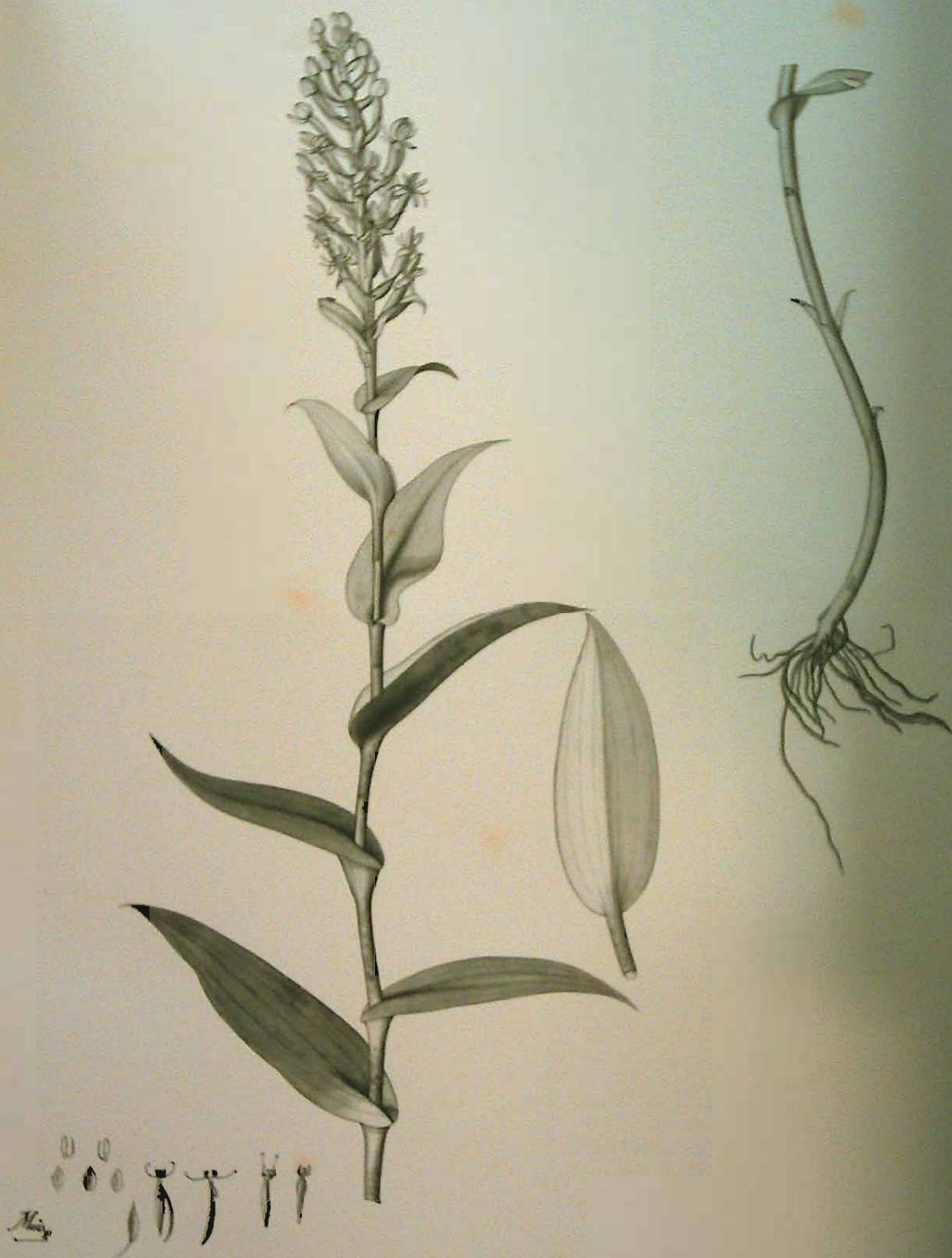
Habenaria monorrhiza (Sw.) Reichb. f.