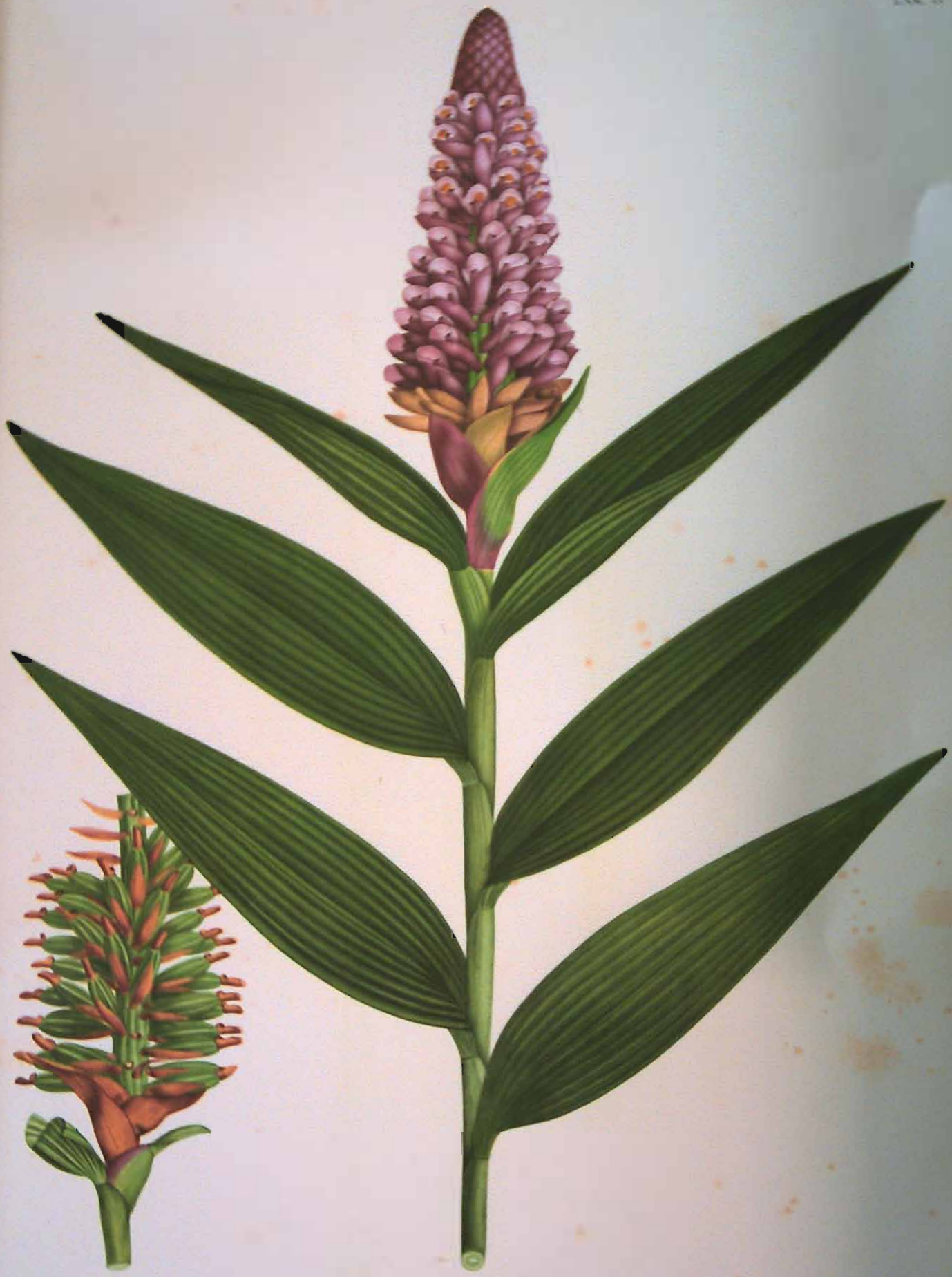
Elleanthus columnaris (Lindl.) Reichb. f.