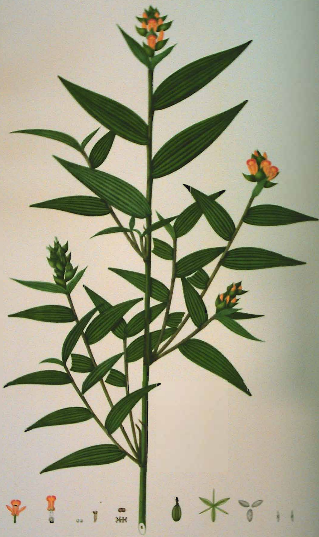
Elleanthus aurantiacus (Lindl.) Reichb. f.