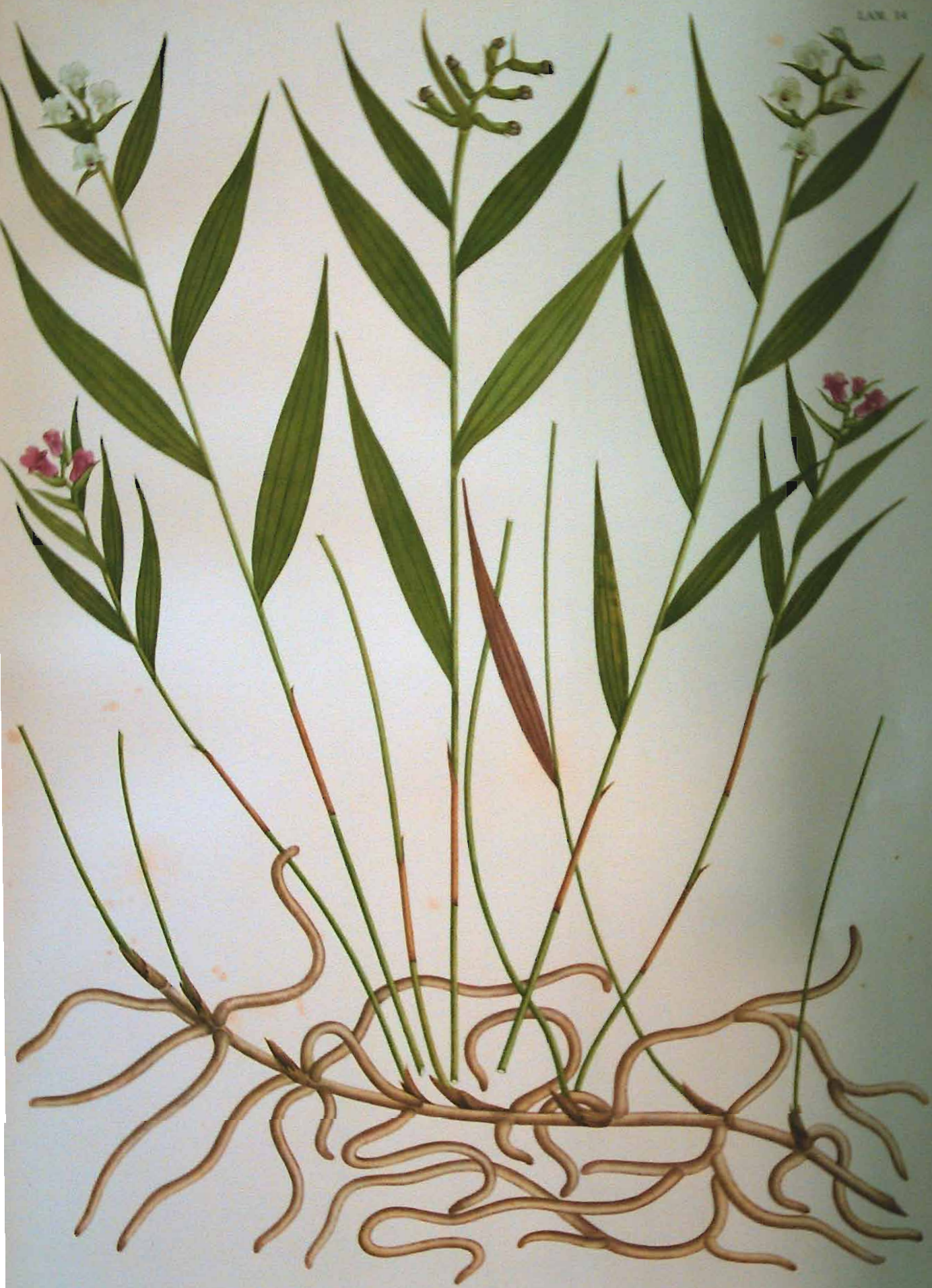
Elleanthus gracilis (Reichb. f.) Reichb. f.